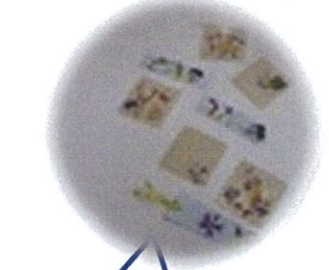
押し花で、しおりを作りました。