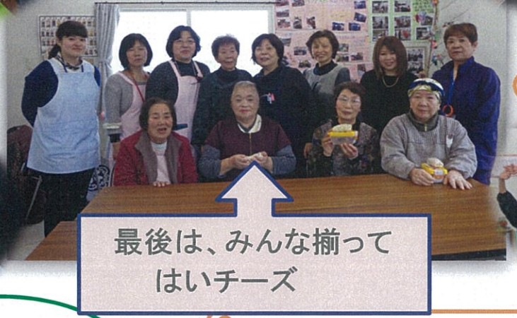
最後は、みんな揃って はいチーズ