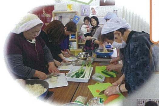
こまかぐ、切んだあよ