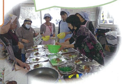
ねぎが、さぎだあよ 最後に、しょうがわっ せえねでね