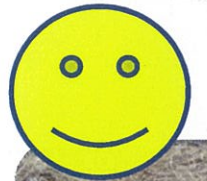
小さい春 見~つけた