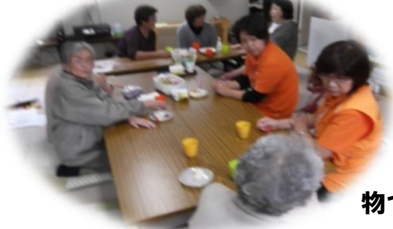
物づくり(クラフト)